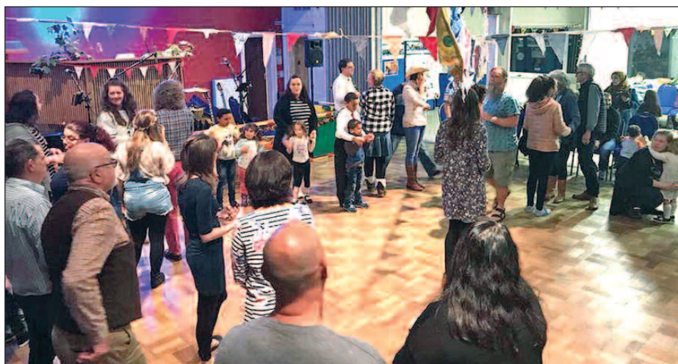
Dawnsio yn Sandfields

• Y bydd Cristnogion yn dod atom i'n helpu ni yn y gwaith hwn.