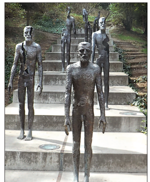
Cofeb ym Mhrâg i gofio am y rhai ddiodeffodd o dan llywodraethau totalitaraidd. Dangosir sut y mae trais dros amser yn difa'r ddynoliaeth yn ogytal a'r person.