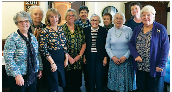
Croesawyr wrth y byrddau