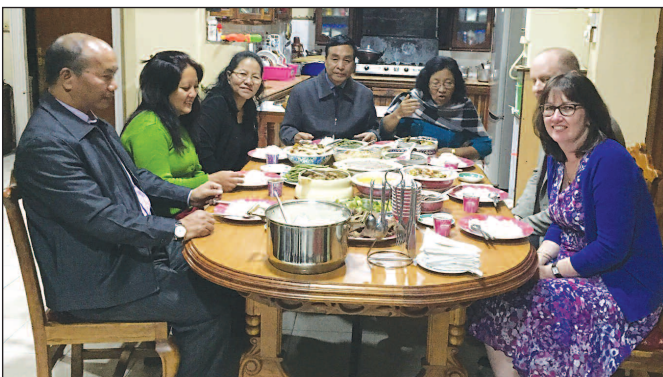
Y wledd a'r croeso yn Mizoram

roeddwn i'n siŵr i mi yfed digon; y gwir oedd nad oeddwn mewn cyflwr i wybod na meddwl yn glir. Rwy'n gweld yr un syched sydd yn Eseaia 55 o'm cwmpas heddiw, a neb yn ceisio'r dyfroedd bywiol sydd gan ein Gwaredwr, ond yn drachtio'n ddofn o bethau gwag y byd. Yfed dŵr pydew yn hytrach nac o ffynnon gloyw bywiol lesu.