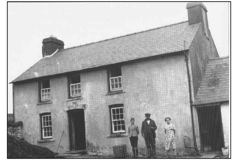
Waunlwyd – yma, ar ddiwrnod 'madael y teulu, y dywedodd y fam-gu wrth Iorwerth Peate am fynd ar ei union yn ôl i Gaerdydd am ei bod hi'n 'ddiwedd byd fan hyn'

Yn raddol, fe wawriodd arnynt – doedden nhw byth yn mynd i ddychwelyd i'r Epynt. Falle fod rhai yn gwybod hynny o'r dechrau. Mynnodd un wraig fynd â drws y tŷ gyda hi;