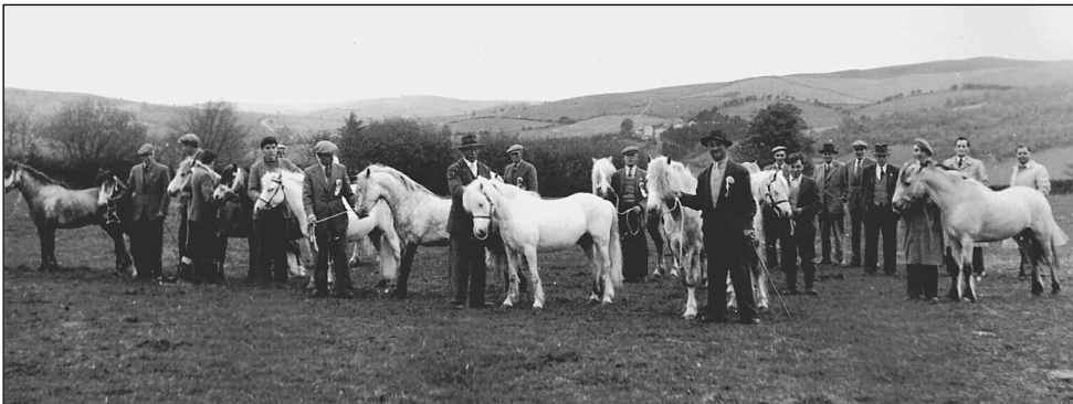
Sioe stalwyni ar fynydd Epynt, 1930

Epynt wedi ei ddifetha am byth gan ffrwydron, mae'n amhosibl ei ffermio byth eto – mae gormod o wenwyn ynddo. Ac ers y nawdegau, yn hytrach na chilio, mae'r fyddin wedi perchnogi mwy o dir yn yr ardal. Yma yr hyfforddwyd y milwyr fu'n ymladd yn Afghanistan ac Irac. Mae'n felltith sy'n parhau.