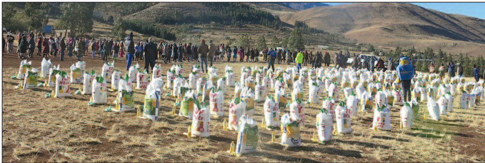
Grawn a nwyddau'n barod i'w casglu

Mae Is-bwyllgor y chwirydd wedi bod yn cefnogi eglwys, ysbyty a chymuned Trebellong yn Lesotho ers peth amser. Yn yr ysbyty mae tîm cryf o nyrsys a chwrselwyr HIV a TB. Maent yn teithio i bentrefi pell gyda phroffion, triniaeth, brechiadau a chyngor. Mae'r bobl a Llywodraeth Lesotho yn gwerthfawrogi hyn yn fawr. Dyma yw hanes gwasanaethau iacháu Cristnogol ar hyd y blynyddoedd. Maent yn mynd at y bobl dlotaf ac yna mae'r llywodraethau yn mabwysiadu'r syniadau a'r cynlluniau. Mae'r ysbyty yn hyfforddi ugain o Weithwyr Iechyd Pentref drwy roi cwrs pedwar diwrnod iddynt yn yr ysbyty. Y gobaith yw cael pentrefi sy'n rhydd o HIV a TB drwy gwrsela, profi a chadw llygad ar yr ugain y cant o'r boblogaeth sy'n dioddef o HIV.