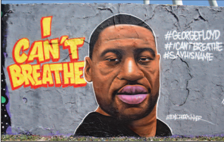
Murlun o George Floyd, Berlin (cliciwch yma: http://tiny.cc/hop4qz )

Y delweddau gwreiddiol o Miniapolis o blismon gwyn yn llofruddio dyn du o flaen tystion a camera.