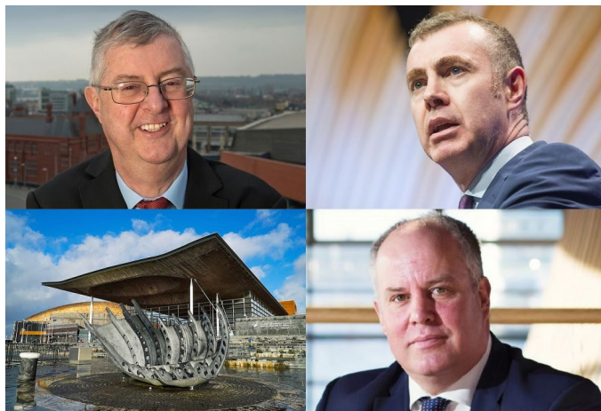
Y tri arweinydd ar ddechrau'r tymor newydd

Beth felly yw sefyllfa a statws ffydd yn y Senedd? Does dim adeilad capel na stafell weddi o fewn y Senedd o gwbl, yn wahanol i San Steffan. Does dim capel nac eglwys chwaith ym Mae Caerdydd erbyn