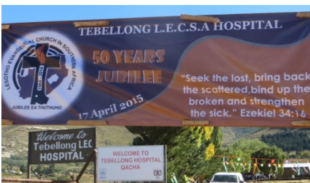
Sasiwn y Chwiorydd, Ysbyty Tebello

Dilynwyd hyn gyda chyflwyniad i'r llyfryn 'Myfi yw Bara'r Bywyd' gan y Parch Eirlys Gruffydd-Evans. Eglurodd fod y llyfryn yn cynnwys gwasanaethau, astudiaethau, tystiolaethau, newyddion am brosiectau cenhadol a gwaith crefft i gefnogi elusennau. Cyfeiriodd at y ffaith fod casgliad arbennig Chwiorydd Eglwys Bresbyteraidd Cymru yn noddol prosiectau dramor a chartref ac yn gyfle i rannu cariad.