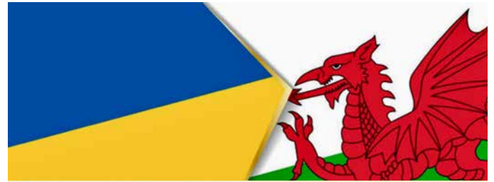
CYMRU'N CYDSEFYLL AG WCRÁIN

Yn rhifyn yr wythnos diwethaf o Cenn@d , cyfeiriwyd at ymgyrchoedd codi arian a chasglu nwyddau i gefnogi ffoaduriaid Wcráin. Ar hyd a lled Cymru yn ogystal daeth tyrfaoedd ynghyd i gynnal gwynosau a chyrddau gweddi awyr agored. Lansiodd apêl DEC (Disasters Emergency Committee) hefyd, ac yn y llun isod gwelir cynrychiolwyr o'r prif asiantaethau dyngarol, gan gynnwys Cymorth Cristnogol, Cafod, Tearfund, Oxfam, Achub y Plant a'r Groes Goch, yn sefyll mewn undod o flaen y Senedd yng Nghaerdydd. Dyma ddetholiad o wynosau a gynhaliwyd mewn pentrefi, trefi a dinasoedd ar hyd a lled Cymru.