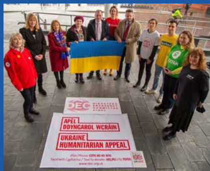
Lansio apêl DEC