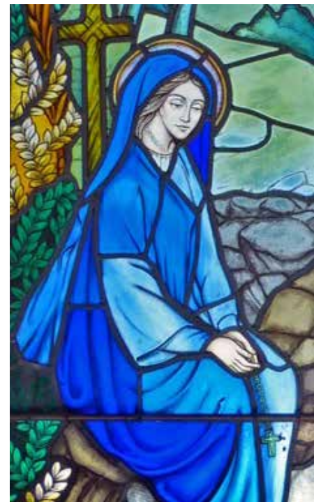
Santes Gwenffrewi yn siarad â'i chyfarwyddwr ysbrydol Beuno Sant

Arglwydd Iesu Grist, Ailgysegrwn ein bywydau i ti, wrth i ni geisio sefyll yn gadarn yn dy gariad. Helpa ni i gadw ein golygon ar addewid d'ogoniant, ac i helpu'r gwan, y tralodus, pawb sydd heb gyfeillion, heb rym ac sy'n fregus. Helpa ni i fod yn dystion i'th gariad trawsnewidiol a fydd yn y diwedd yn sychu ymaith bob deigrlyn. Amen.