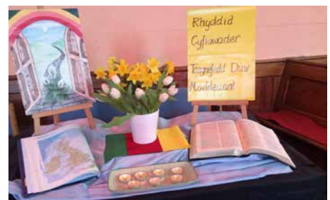
Y bwrdd wedi ei hulo'n barod yn Seion, Capel Seion ger Aberystwyth