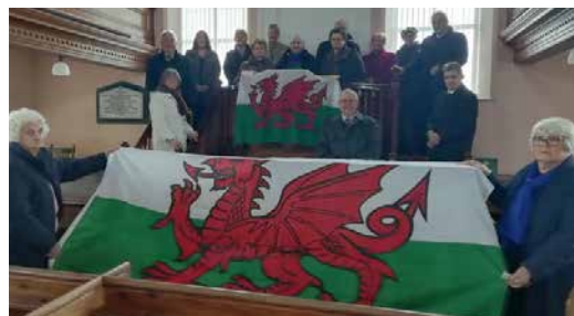
Capel Bryngwenith, Henllan, Castellnewydd Emlyn