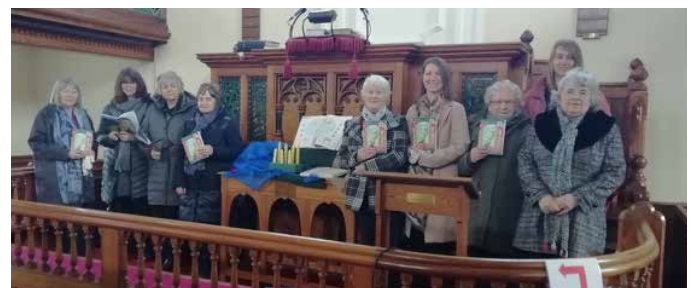
Capel Pisgah, Talgarreg