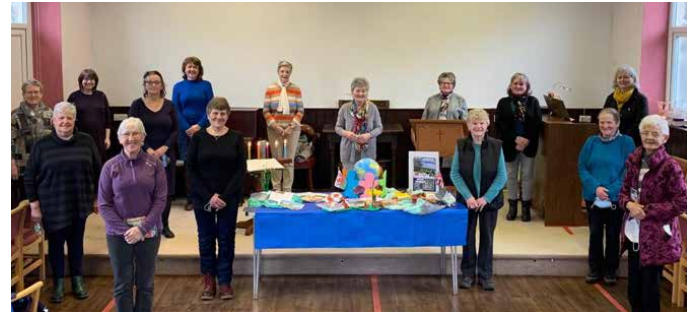
Recordio'r gwasanaeth yn Llanuwchllyn