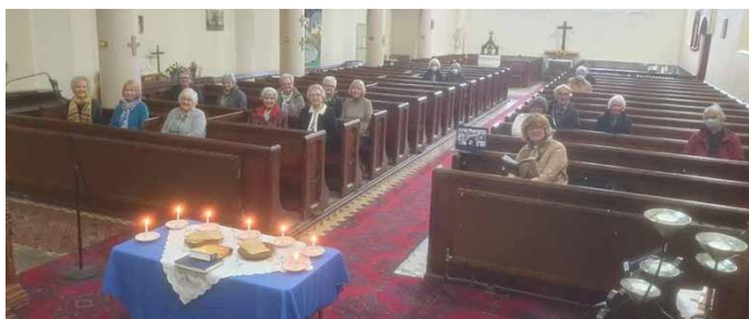
Oedfa undebol hybrid yn Eglwys Crist, Caerfyrddin