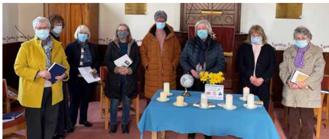
Y rhai gymerodd ran yn y gwasanaeth dwyieithog yn Soar, Nercwys