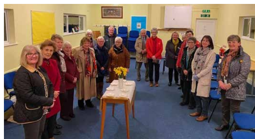
Cana, Bancyfelin, Sir Gaerfyrddin