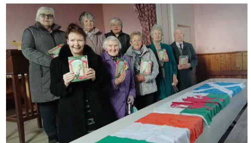
Capel Brynmoriah, Brynhoffnant