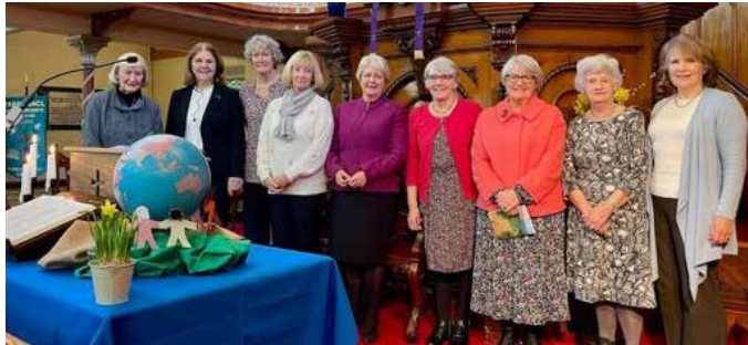
Gwasanaeth undebol eglwysi Cymraeg Caerdydd yn y Tabernacl

ac roedd llawer iawn o'r byrddau a baratowyd fel ffocws ar gyfer y gwasanaeth yn cynnwys llieniau glas a chennin Pedr, sef lliwiau baner Wcráin. Dyma rai lluniau o fannau gwahanol yng Nghymru a fu'n cynnal y gwasanaeth arbennig hwn yn ystod penwythnos cyntaf Mawrth eleni.