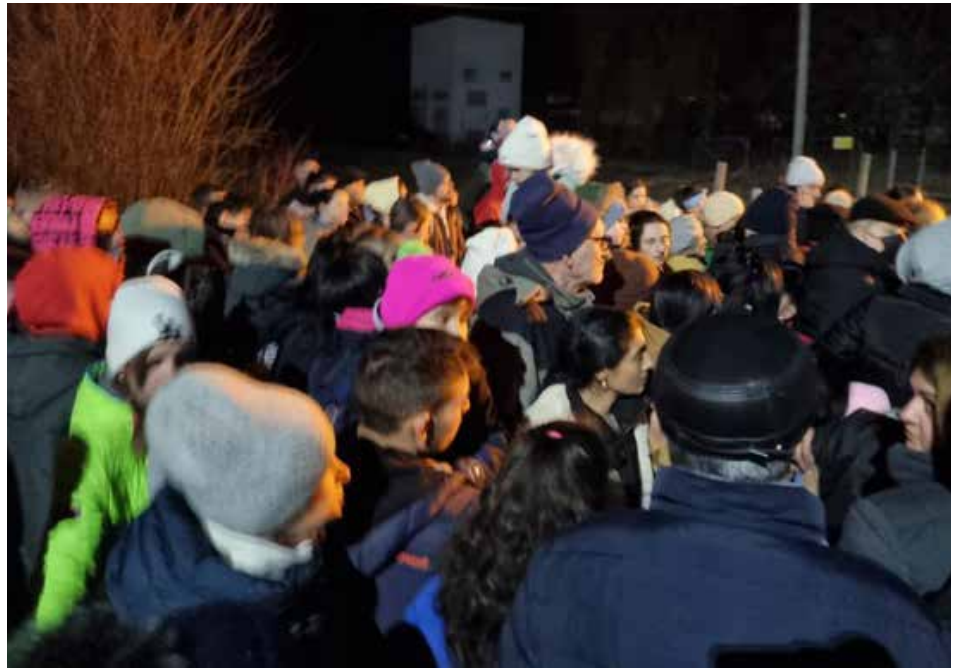
Mae miloedd o ffoaduriaid ar draws Wcráin yn ceisio lloches mewn gwledydd eraill.