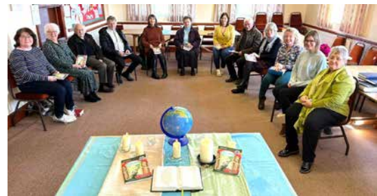
Capel Hermon, Cynwil, Sir Gâr