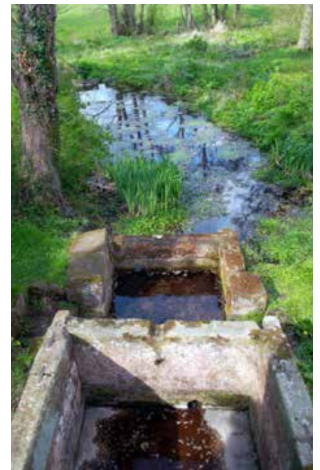
Y Baddondai yn Ffynnon Gwenffrewi, ger Woolston, Swydd Amwythig cc-by-sa/2.0 - © Des Blenkinsopp - geograph.org.uk/ip/2945521

Arglwydd Iesu Grist, Diolchwn i ti am ein tywys at afonydd yn y diffeithwch. Diolchwn i ti am roi i ni ddŵr y bywyd i'w yfed, a'th fod yn ein llenwi ni, ein pobl, yn unig â phethau da. Dysga ni i ddiolch bob dydd am estyn dy law i'n tywys, am ffynhonnau iachâd ac ysbrydoliaeth, a helpa ni i arwain pawb arall sy'n sychedu am obaith, at lif diderfyn dy drugaredd, dy ras a'th gariad. Amen.