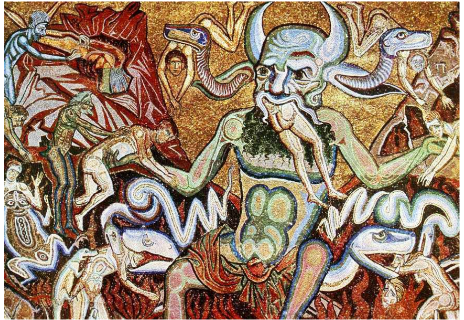
Llun: Y Ffarn, gan Coppo di Marcovaldo, Nenfwd Mosaic, Beddydfan San Giovanni https://tinyurl.com/bd5hfdvb

Felly, gyda golwg ar y dinistr a'r gyflafan sydd ar droed ar gyrion Ewrop y dyddiau hyn rwy'n edrych ar bethau ar hyn o bryd. Nid wyf yn gwybod a fydd yna gadoediad wedi ei drefnu rhwng Rwsia Fawr ac Wcráin. Fedrwn ni ond gweddïo a gobeithio y caiff y rhai sydd wedi eu dal ym merw brwydro dieflig gweision