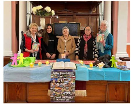
Gwasanaeth bendithiol Chwirydd Clapham