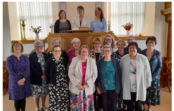
Y merched a gymerodd ran yn yr oedfa