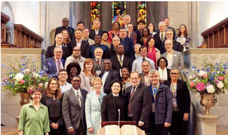
Aelodau'r Pwyllgor Gweinyddol yn 2019. Cyfarfu yn Kappel am Albis, y Swistir, ond y llun yn dilyn oedfa'r Sul yn eglwys Brotestannaidd Grossmünster Zurich, sydd â chysylltiad â'r Diwygiwr Huldrych Zwingli ac yn un o'r safleoedd pwysigaf yn hanes Diwygiad y Swistir-Almaen

Ydy'r Cymundeb o bwys i anghydfurfwrwyr Cymru? Heb amheuaeth! Mae'n hollbwysig ein bod yn cael ein cynrychioli, ein gweld a'n clywed yn y cyrff cydenwadol hyn. Trwy drafodaeth, dadl a sgwrs, dyfnheir ffydd ac ymwybyddiaeth o'r hyn sy'n digwydd yn enw ein Harglwydd ledled y byd yr ydym yn gyd-ddinasyddion ohono. Mawr yw fy nyled i Undeb yr Annibynwyr am y fraint o gael bod yn rhan o'r Cymundeb; rwy'n gobeithio'n fawr fod fy nghyfraniadau i'r trafodaethau yn sicrhau bod ein llais a'n cenhadaeth yng Nghymru yn cael eu clywed. Mae'n bwysig eu bod, gan fod gennym brofiadau unigryw i'w cynnig i'n cyd-Gristnogion.