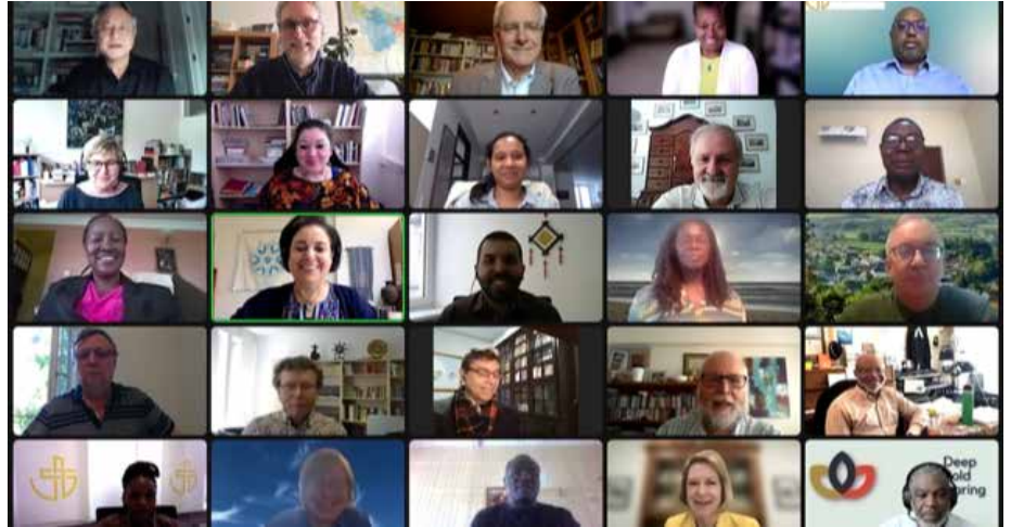
Pwyllgor Gweinyddol 2022 yn cyfarfod yn rhithiol

Clywsom gan Grŵp Rhaglen y Cynllun Strategol (SPPG) am lwyddiant y broses ddirnadaeth “COVID a Thu Hwnt”, a gynhaliwyd o dan nawdd y Cymundeb rhwng Rhagfyr 2020 a Thachwedd 2021. “Mae'r Cymundeb wedi sylweddoli,” meddai Rathnakara Sadananda, Cydlynnydd y Grŵp, “beth sy'n bosibl er sicrhau cynnwys pobl yn ein gwaith. Yn wir, mewn rhai ffyrdd mae'r Cymundeb yn fwy cysylltiedig ac yn fwy bywiog nag erioed yn dilyn y pandemig.” Un datblygiad cyffrous yw bod y Cymundeb, gan weithio ar y cyd â'r Eglwys Efynglaidd Waldensian ac