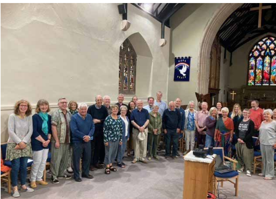
Criw'r encil yn Eglwys y Santes Fair, Porthaethwy

Am adroddiad llawnach o gynnwys yr encil, ewch i wefan Cristnogaeth21: https://cristnogaeth21.cymru/encil-2022/