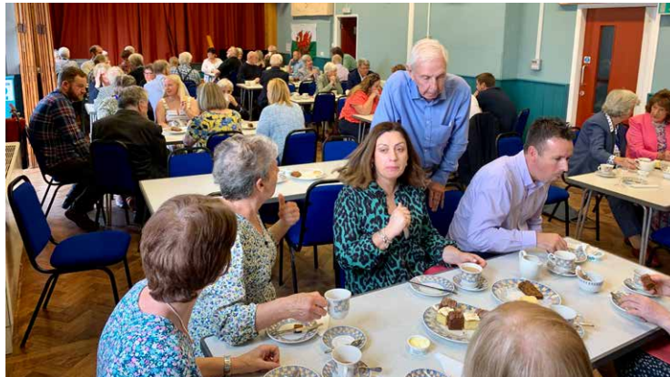
Mwynhau'r gwmniaeth yng nghanolfan y pentref