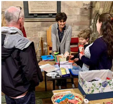
Criw yn cyfrannu at y gwaith celf