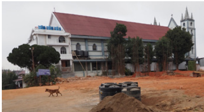
Safle adeilad newydd y ganrif ger hen eglwys Jaiaw