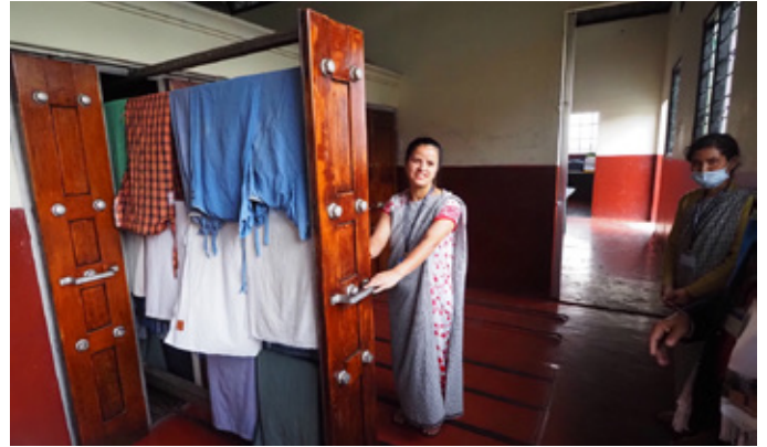
Sychu dillad o dan yr hen drefn yn yr olchfa

Gerllaw roedd y golchdy. Er bod ganddynt un peiriant golchi, roeddynt yn dal i ddefnyddio'r un gwreiddiol ac roedd mangl hen ffasiwn a chypyrddau sychu cyntefig hefyd yn dal i gael eu defnyddio. Delwedd amgueddfa oedd yma – yn ceisio diwallu anghenion golchi ysbyty yn y 21ain ganrif.