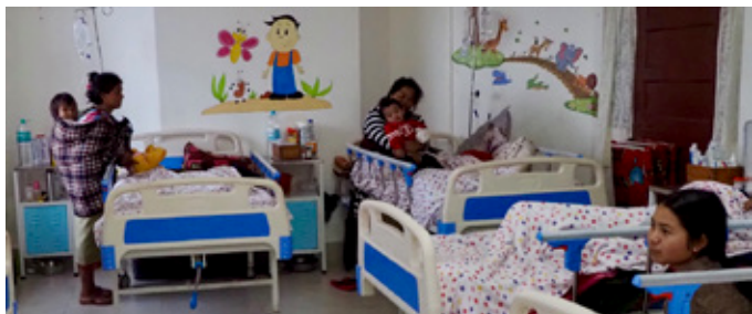
Gwlâu newydd yn ward y plant