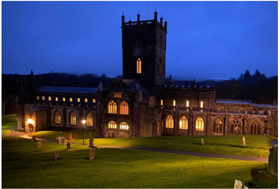
Tŷ Ddewi gyda’r hwyr

1. Gweledigaeth glir yn codi o argyhoeddiad mewnol. Dros y misoedd diwethaf dwi wedi cael argyhoeddiad bod angen sefydlu gwaith newydd yn Hwlfordd er mwyn gwasanaethu dalgylch Ysgol Caer Elen. Er bod oedfaon Cymraeg wedi cael eu cynnal yn Hwlfordd yn achlysurol, does dim oedfaon cyson,