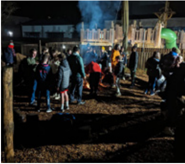
Pawb yn dod i adnabod eu gilydd ar y noson cyntaf o amgylch y tân