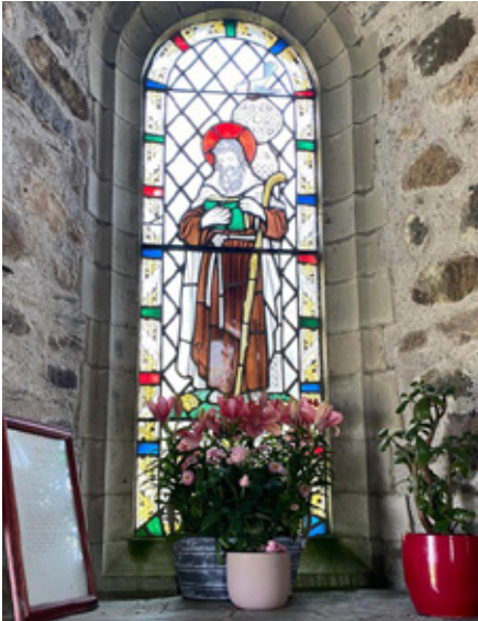
Dewi Sant mewn ffenestr liw gerllaw Tŷ Ddewi

ifanc ayb. Ond tybed a ydym, wrth wneud hyn, yn dechrau yn y man anghywir? Gwell dechrau mewn man arall, dechrau gyda mawredd tosturi Duw, buddugoliaeth yr Arglwydd Iesu, grym yr Ysbryd Glân, gogoniant yr efengyl, cariad Iesu tuag at ei ddyweddi, yr Eglwys, y gobaith i'r colledig yn yr efengyl. Felly, rhaid i unrhyw waith newydd fod yn 'efengyl-ganolog', yn unol â gorchymyn Iesu i'w ddisgyblion. "Rhoddwyd i mi," meddai,