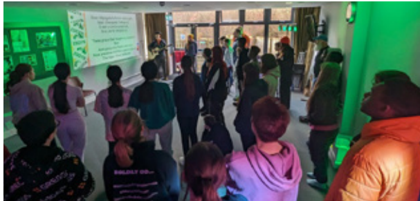
Cyfle i addoli dros y penwythnos