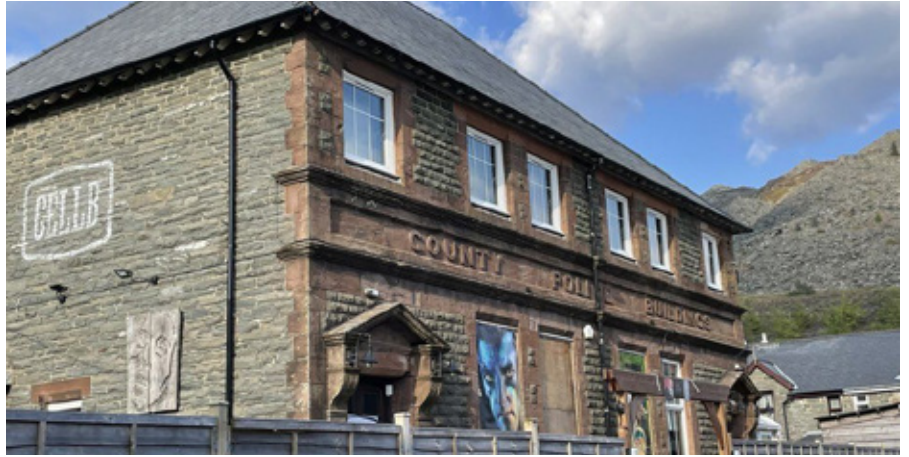
Adeilad CellB, yr hen garchar a gorsaf yr heddlu yn y Blaenau