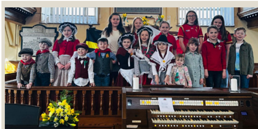
Plant ysgol Sul ac ieuentid Rhydfendigaid a fu'n datlu Gŵyl Ddewi mewn gwasanaeth yn y capel