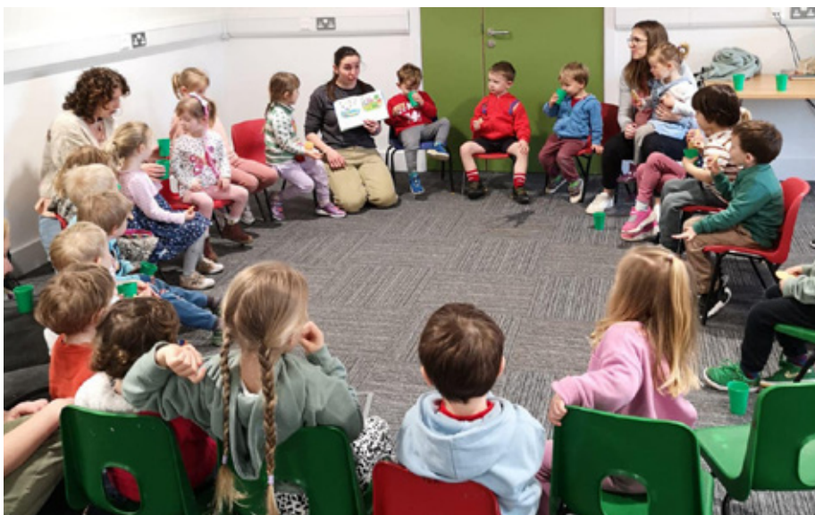
Criw da o blant oed cynradd yn mwynhau'r clwb plant Beiblaidd dyddiol