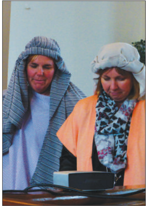
Agor y Llyfr