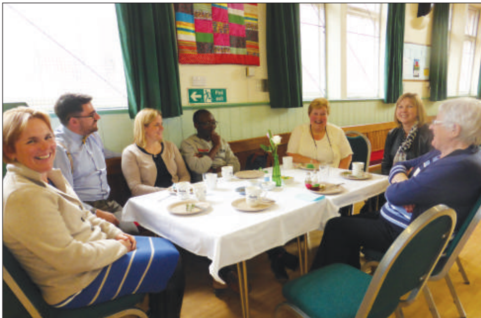
Capel Moreton, Wirral

Hoffem gyflwyno ein diolchiadau eto am y lletygarwch a