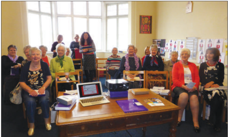
Capel Trinity, Wrecsam