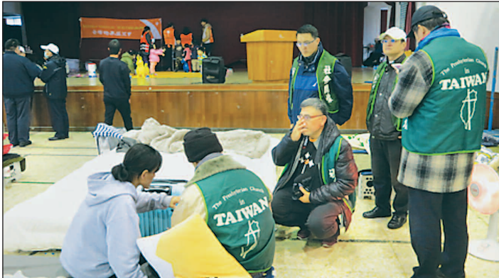
Gweinidogion Eglwys Bresbyteraidd Taiwan yn ymweld â lloches wedi'r ddaeargryn.

Gofynnodd yr eglwys am gefnogaeth yr eglwysi sydd mewn perthynas â hi drwy CWM. Gofynnir i ni weddio dros y rhai sy'n dioddef oherwydd y ddaeargryn ac yn arbennig y gweithwyr sy'n ceisio achub bywydau'r rhai oedd wedi eu dal mewn adeiladau peryglus. Nodwyd bod Taiwan yn wynebu cyfod o dywydd oer a gwlyb iawn. Er bod ysgolion ar gau oherwydd gwyliau cenedlaethol i ddathlu'r Flwyddyn Newydd Tsieinaidd rhwng 4ydd a'r 20fed o Chwefror, mae'r ddaeargryn wedi effeithio ar fusnesau lleol ac ar dwristiaeth.