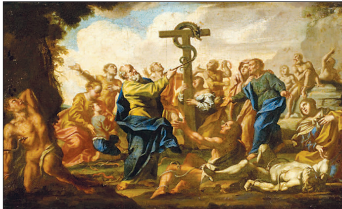
Wikimedia – Francesco Camora

Nodwch hyn, roedd pawb a oedd yn edrych ar y sarff ar y polyn yn cael byw.