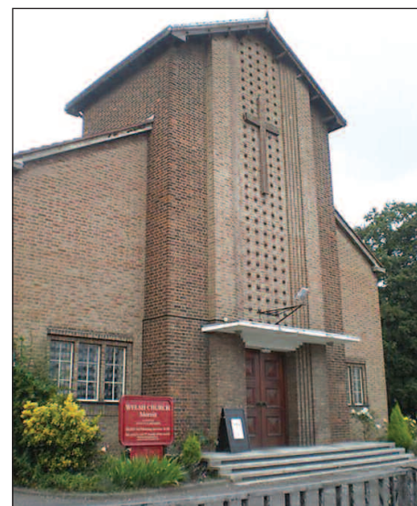
Capel Moreia, Leytonstone

Y flwyddyn nesaf (2019) cynhelir Cymdeithasfa'r Gwanwyn yn