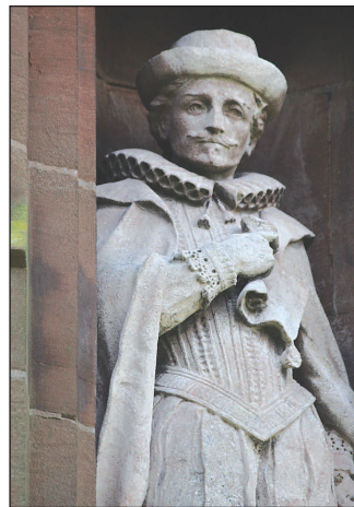
William Salesbury o Wikimedia – awdur Llywelyn2000 a defnyddir drwy drwydded Creative Commons Attribution-ShareAlike License

Ond, er gwaethaf niwlogrwydd llawer o'r manylion bywgraffyddol am Salesbury, mae disgleirdeb ei gyflawniadau ysgolheigaidd a diwylliannol (yn arbennig ar ddau gyfnod yn ei fywyd) yn syfrdanol lachar. Fe'i gyrrwyd yn ei flaen gan dri dylanwad grymus, a'r cyfuniad rhyngddynt yn creu person o gymwysterau unigryw: (i) dyneiddiaeth y Dadeni Dysg, a'r cymhelliad i aildarganfod ffynonellau clasurol diwylliant Ewrop ac i feistrolïo ieithoedd hen a modern; (ii) argyhoeddiad Protestannaidd, a afaelodd ynddo (siwr o fod) yn Rhydychen a Llundain, a'r pwyslais mai ar awdurdod y Beibl yn unig ( sola Scriptura ) yr oedd ffydd Gristnogol ddilys i'w seilio; (iii) ymwybod byw â'r Gymraeg ac â thraddodiad llenyddol Cymru, diolch yn arbennig i'w gyfeillgarwch â'r bardd Gruffudd Hiraethog. "Mynnwch ddysg yn eich iaith", meddai wrth y Cymry yn 1547, ychydig dros ddegawd yn unig wedi'r Ddeddf Uno a'i "chymal iaith" bondigrybwyll, a dilyn hynny ag anogaeth arall, yr un mor daer, "Mynnwch yr Ysgrhythur Lân yn eich iaith".